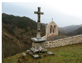
chapelle St Etienne

Retour devant l'hôpital de Montbrison pour ceux qui veulent récupérer leur véhicule.