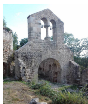
Chapelle Saint Alban

Coût de la journée, restaurant inclus : Adhérents 3 associations 20 euros, Non Adhérents 30 euros. Inscription au plus tard le 30/09/2019 avec paiement par chèque